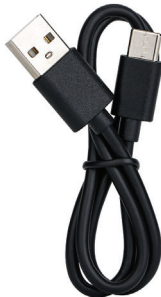
Кабель USB Type-C для зарядки и передачи информации