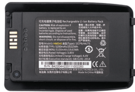
Аккумуляторная батарея (Li-ion) 5000mAh