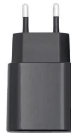
Адаптер быстрой зарядки