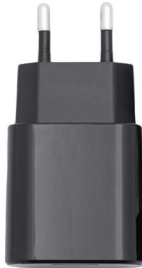
Адаптер питания (2A)