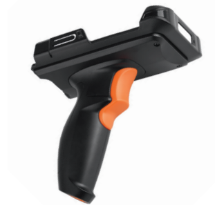
Пистолетная рукоятка с кнопкой сканирования