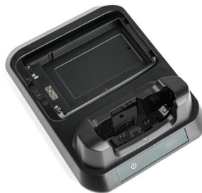
Зарядная подставка для ТСД и аккумулятора