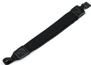
Ремешок на руку