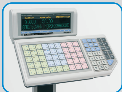
Большая удобная и функциональная клавиатура